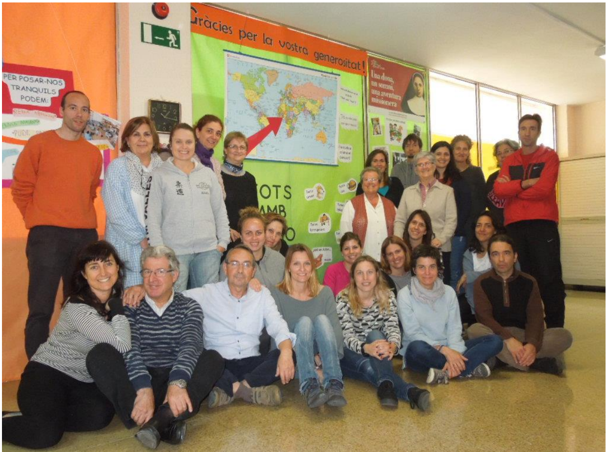
Claustro de Profesores Colegio M. Alfonsa Cavin