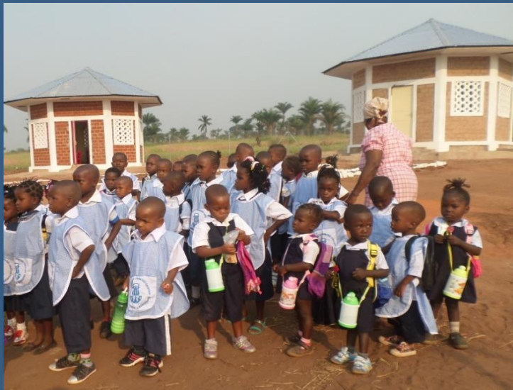
Presència MIC a la R.D. del Congo. 2015