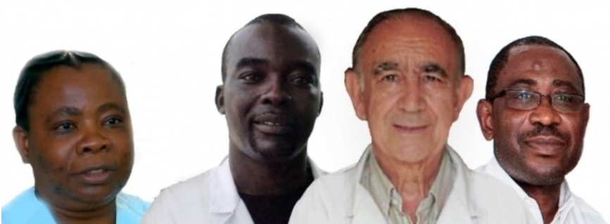
Misioneras Inmaculada Concepción, Pozuelo de Alarcón, 9 de agosto 2015